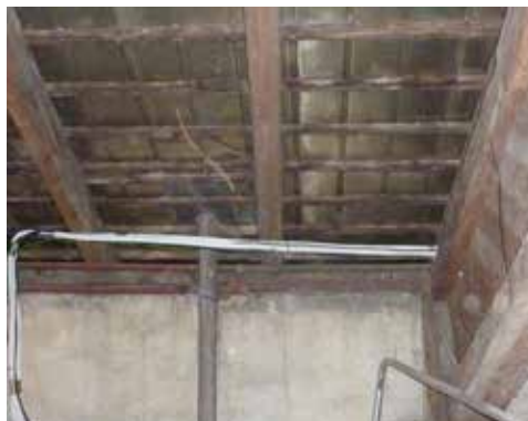
Opravy se dočká i střecha kulturního domu.

da o provedení práce do 300 hodin ročně s panem Liborem Blatákem a žádost o trvalý zábor pozemku parc. č. 441/2 v majetku státu.