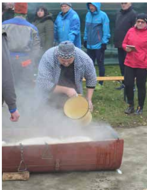
Atraktivní akcí pro občany obce bude na začátku měsíce března Hněvotínská zabijačka.