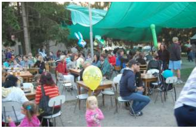
Akce se za velmi příjemného počasí dle odhadu zúčastnilo přibližně 450 lidí z naší obce.

V lidové tradici bývá počátek května spojen se stavěním májek. Obvyčej stavění májek je velmi starý a znají ho po celé Evropě. Možná je to pozůstatek prastarých jarních slavností, kdy strom představoval strážného ducha obce.