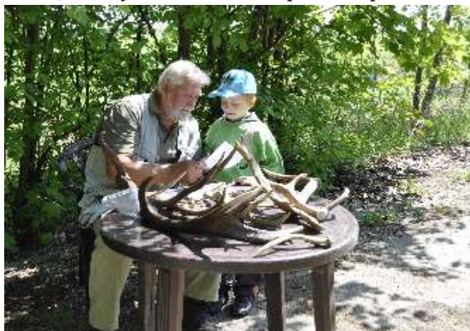
Na stezce na děti čekalo 10 stanovišť s praktickými úkoly. Poznávání shozů, kůží, stromů, ale i pozorování zvěře dalekohledem, střílba ze vzduchovky anebo určování hlasů zvířat.

Čas pokročil a s blížící se 13. hodinou mi odevzdává svou bodovací tabulku i poslední soutěžící. Nastává sčítání bodů a oprava testů, pro děti nudná a dlouhá chvíle čekání, kterou jim chceme ukrátkat opékáním špekáčků.