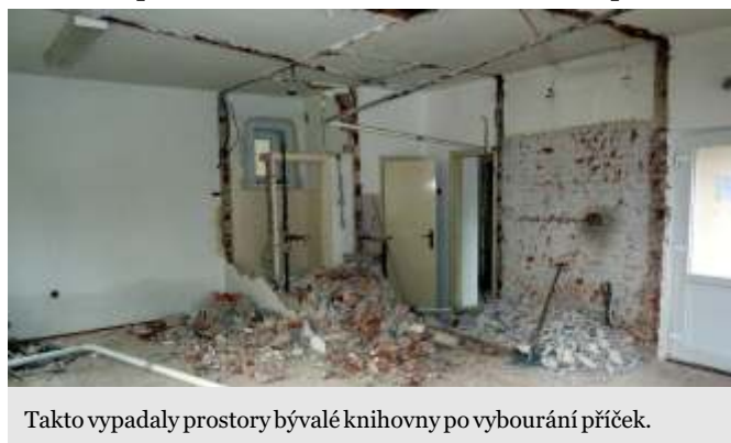
Takto vypadaly prostory bývalé knihovny po vybourání příček.

V prostorách bývalé knihovny se buduje klubovna pro složky, která má nahradit zasedací místnost obecního úřadu v 1. patře. Její kapacita bude přibližně 25 lidí, vybavena bude počítačovým koutkem, malou kuchyňskou linkou a audiovizuální technikou. Od tohoto zařízení očekáváme vyřešení problému se schůzovní činností jednotlivých zájmových složek, možnost pořádání menší kulturně společenské akce třeba formou besed apod..