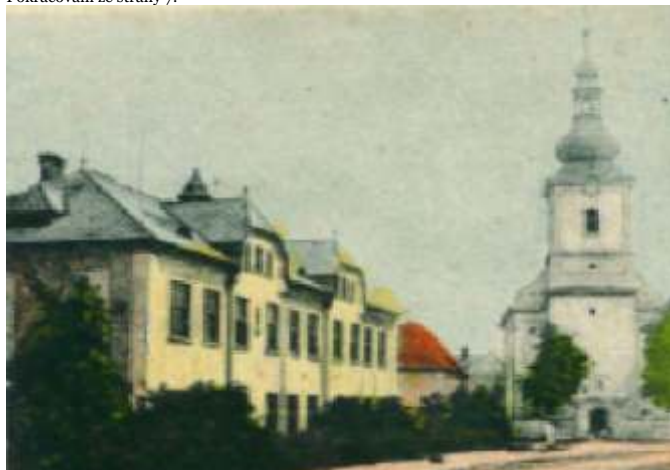
Budova školy a farní kostel na fotografii z roku 1930.

tak dopomohl postavit 16 nových domů. Založil s místní Národní jednotou „Stavební fond“. Vymohl u Ústřední matice školské v Brně stavbu budovy (před stavbou sloužila jako původní budova české školy – nyní Dům s pečovatelskou službou) se 14 byty. Vymohl stavbu nové měšťanské školy, která stála 1,5 miliónu korun tehdejší měny a byla slavnostně otevřena v roce 1929 s hrdým názvem na štítě „Česká měšťanská škola“. Tomuto dění v Hněvotíně předcházela dne 13. června 1926 Manifestace hanáckého lidu, pro posílení národního vědomí Čechů významná událost.