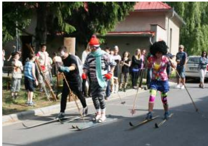
Na start se postavilo celkem 19 skvěle připravených závodníků, z toho 11 dětí, 3 ženy a 5 mužů.