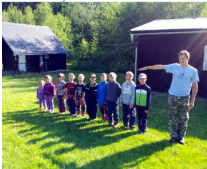
Soustředění se zúčastnilo 10 dětí v rozmezí od 4 do 9 let.

Mladí hasiči zde museli prokázat různé znalosti a dovednosti jako je například řezání pilou, poskytnutí první pomoci, orientace v prostoru s buzolou, rozmotání hasičské hadice aj.