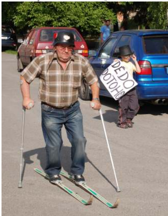
Jednalo se o běžecké lyžařské závody s velkou dávkou recese a u některých účastníků i s velkou dávkou rodinné podpory.

1.ročník „Hněvotínské lyže“ se konal 26. května pod ještě stojící májkou u hasičské zbrojnice. Slibovaný sníh dovezen nebyl a tak se muselo běžet „na sucho“.