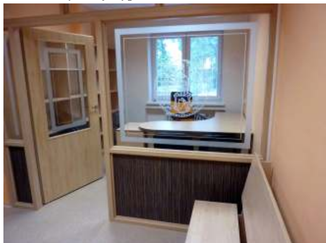
Tato kancelář bude určena pro výkon administrativních úkonů pro obyvatele obce, především placení poplatků a služby v rámci czech-pointu.

Nejprve se provizorně přestěhovala knihovna do obřadní místnosti, aby nebyl provoz knihovny přerušeno. Ihned poté začaly stavební práce a v první etapě byla vybudována nová kancelář obecního úřadu. V současné době se dovybavuje výpočetní technikou.