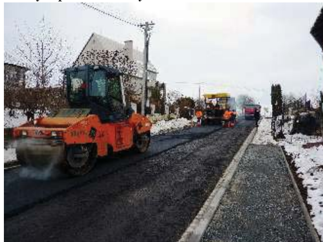
Na snímku jsou zachyceni pracovníci firmy Skanska při pokládání povrchu komunikace. Na horizontu již chybí silueta staré lípy.

S rekonstrukcí části havarijních vodovodních přípojek k rodinným domům na Velkém Klupoři jsme začali již v jarních měsících. Bohužel, vyřízení všech nutných vyjádření a stavebních povolení společně s třicetidenními lhůtami na případná odvolání a na nabytí právní moci posunuly započetí prací až do začátku měsíce října. Cítili jsme však dluh k občanům, kteří v těch prašných a hlučných podmínkách bydlí.