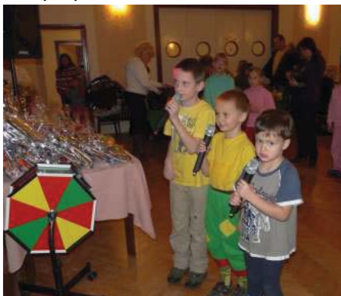
Velký ohlas však mělo dětské karaoke, ve kterém mohly děti předvést svůj pěvecký talent.