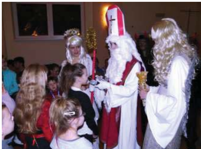
Od 16 hod. byla v sále Kulturního domu Mikulášem, čerty a anděly zahájena mikulášská zábava – diskotéka pro děti z mateřské a základní školy.

V pátek 3. prosince se uskutečnila tato již tradiční akce, celkově pátá v pořadí. S ohledem na rozsah akce se do příprav s předstihem zapojila skupina dobrovolných nadšenců. Letošní ročník byl originální svou atmosférou – poprvé na této akci napadl sníh. Nejdříve ho pořadatelé přivítali, ale s přibývajícím množstvím musela do odklizení stále přibývajících sněhu zasáhnout i velká technika.